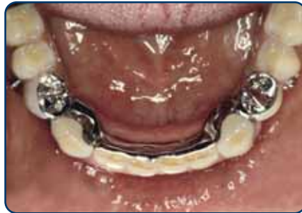
Frameprothese met verankering op kronen