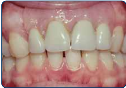
Plaatprothese van voren

De plaatprothese is gemaakt van een roze, tandvleeskleurige kunsthars. Daarin zijn de kunsttanden en -kiezen verankerd. De gehele plaatprothese rust op het slijmvlies van de mond. Deze zit eventueel met ankertjes vast aan overgebleven tanden of kiezen.